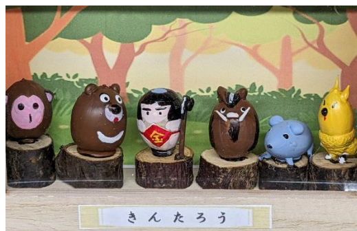
木の実でつくった金太郎の世界

これからの子どもたちの成長を予感させる力強く心地よい音です。5月にこどもの日があるのもこの時期に昔から子どもたちが元気に駆け回る姿があったからではないでしょうか。