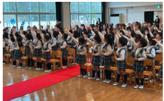
創立50周年記念式典で披露した手話ソング